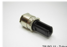
TR PG 11 - Tubus

PG - Klemmhalterung Durchmesser: 10mm Material: Polycarbonat