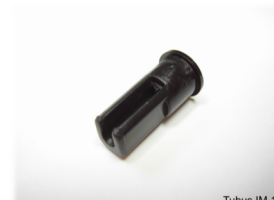
Tubus IM 12

Lichtblende M12x1 Innengewinde Material: Polycarbonat