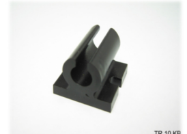
TR 10 KB

Befestigungsschelle Durchmesser: 10mm Material: Polycarbonat