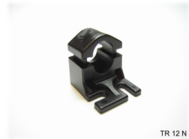
TR 12 N

Klemmhalterung Durchmesser: 10/12/ 18mm Material: Polycarbonat