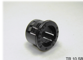
TR 10 SB

Schnapphalterung Durchmesser: 10mm Material: Polycarbonat