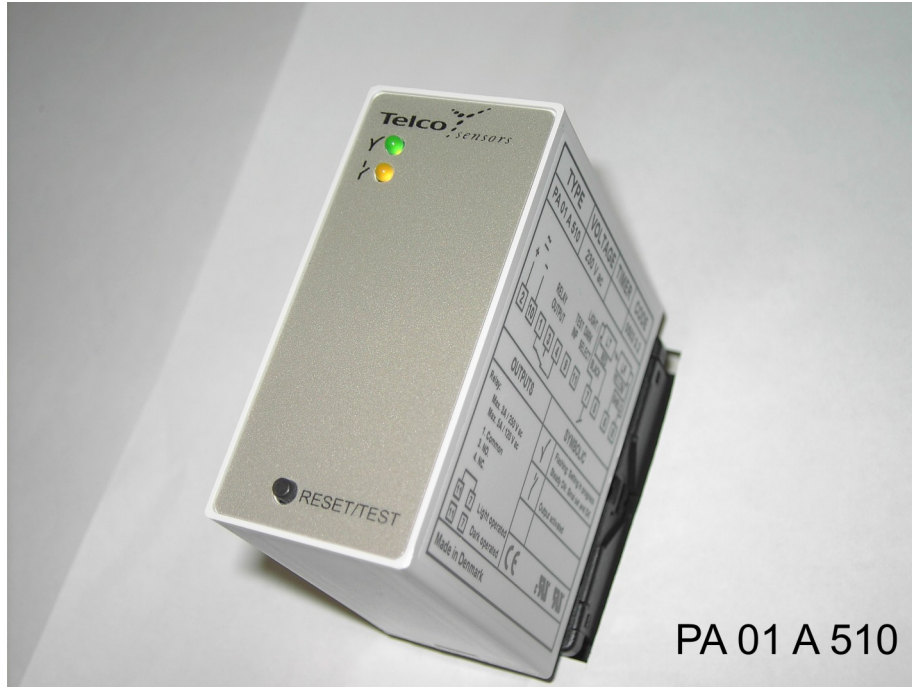
PA 01 A 510

Automatiklichtschrankenverstärker für alle LT/LR Reichweite mit LT/LR 101 = 8m , 100 = 10m , 110 = 23m , 120 = 45m Leistungsstufe K